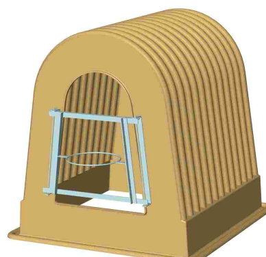
Vue de la niche avec porte-seau simple