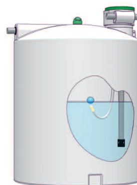
Modèle 10 000 l.