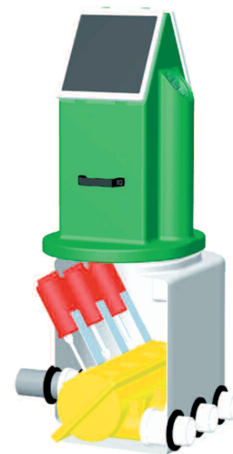
Répartiteur motorisé Alimentation par panneaux solaires