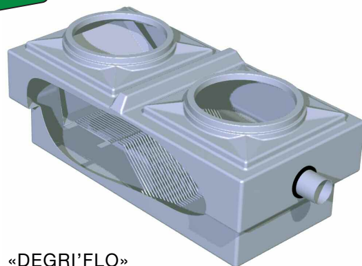
Vues en coupe du «DEGRIFLO»