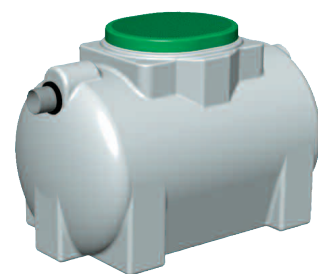
DECOFLO 0,5 m 3

ATTENTION : La "grille" et la "colonne de vidange" ne peuvent fonctionner l'une sans l'autre.